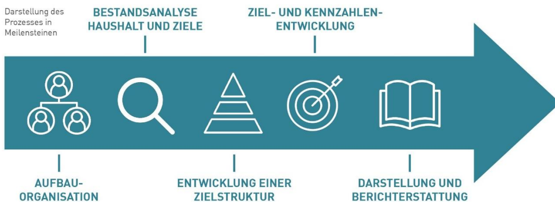
Abbildung 2: Prozess mit Meilensteinen zur Entwicklung eines Nachhaltigkeitshaushalts (LAG21, 2023)

Mit Dank für Ihre Bemühungen und freundlichen Grüßen